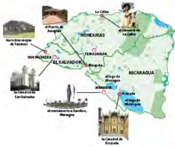
EL SALVADOR, HONDURAS, NICARAGUA