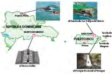
PUERTO RICO Y LA REPÚBLICA DOMINICANA