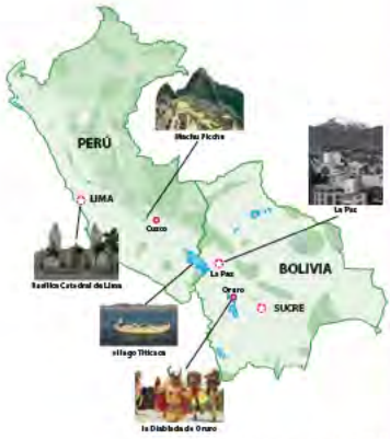
PERÚ Y BOLIVIA