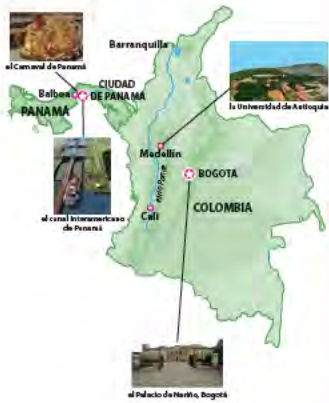
COLOMBIA Y PANAMÁ