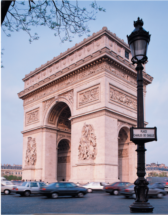
L'Arc de Triomphe, à Paris, en France