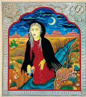
La Llorona (1987) por Diana Bryer (norteamericana, 1942–)

La Llorona es una leyenda mexicana que cuenta la historia de una mujer bella y vanidosa b llamada María. María se casa con un rancho, tienen varios hijos y todos están contentos. Pero un día el rancho empieza a prestarles más atención c a los hijos que a María. María se enfada d y echa e a sus hijos en el río. f Cuando María se da cuenta de su horrible acto ya es tarde g y sus hijos se ahogan. h Al día siguiente la gente del pueblo encuentra a María muerta, cerca del río. Desde ese día en adelante i la gente dice que el espíritu de María va por el río de noche, llorando j en voz alta. Es por eso que la llaman «La Llorona».