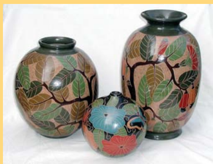
Alfarería de San Juan de Oriente

El pueblo de San Juan de Oriente en Nicaragua se conoce por su alfarería, a un arte que se ha practicado b aquí desde la época colonial. c Las piezas representan tanto temas precolombinos como temas modernos con diseños geométricos.