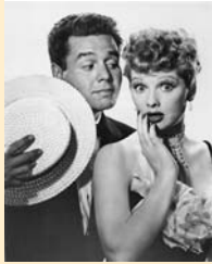
Desi Arnaz con Lucille Ball

¿En quién piensas cuando oyes la frase «superestrella latina»? ¿Piensas en Jennifer López? ¿en Ricky Martin? ¿en Selma Hayek? ¿en Gloria Estefan? Aunque es cierto que estas personas y muchas otras de ascendencia latina tienen gran fama hoy en día, el primer latino de gran fama en la música, el cine y la televisión de los Estados Unidos fue Desi Arnaz de la serie I Love Lucy .