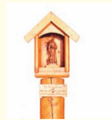
Tiene madera de santo.