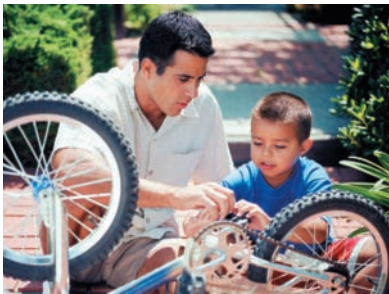
Ayudando a su hijo, este padre comunica su amor y apoyo.

A veces, es necesario soportar lo malo mientras esperas lo bueno.