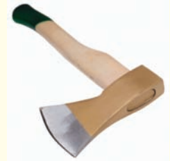
Es un hacha.