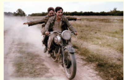
Alberto Granados y Ernesto Guevara son los protagonistas de la película Diarios de motocicleta .

Por último, es un viaje de responsabilidad social, un rasgo asociado con ser una buena persona. A medida que el viaje avanza, ambos personajes comienzan a pensar y a reaccionar de acuerdo a las injusticias sociales con las que se encuentran. Es difícil y hasta peligroso tratar de definir el carácter de un pueblo, sea el pueblo argentino, chileno o latinoamericano a base de estereotipos. Diarios de motocicleta nos invita a cuestionar los estereotipos y a tratar de formar ideas más realistas sobre el carácter nacional, basadas en una multitud de individuos de una nación y sus experiencias.