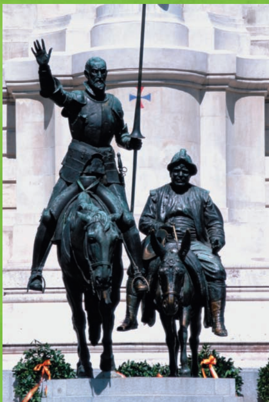
Estatua de Don Quijote y Sancho Panza en la Plaza de España, Madrid