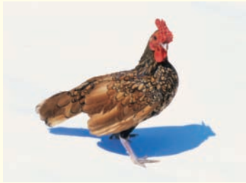
Es una gallina.