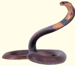
Es una víbora.

En esta lección, conociste a nuestros amigos y escuchaste sus opiniones sobre lo que es ser una buena persona. Las dos lecturas a continuación exploran otros aspectos relacionados con la descripción del carácter de los hispanos, como son el uso de expresiones coloquiales y refranes para identificar y clasificar a las personas, además de los estereotipos que se aplican al carácter hispanoamericano.