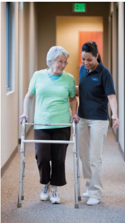
¿Es una buena persona?

but Comienza a llover. It's starting to rain.