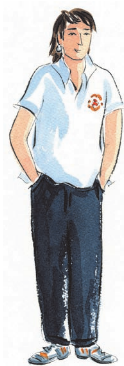
Sono io, Alex. Leggi la mia autobiografia se vuoi conoscermi.