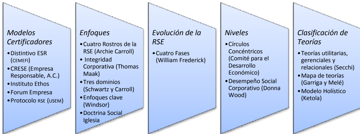
Figura 2 Clasificación de modelos de responsabilidad social empresarial