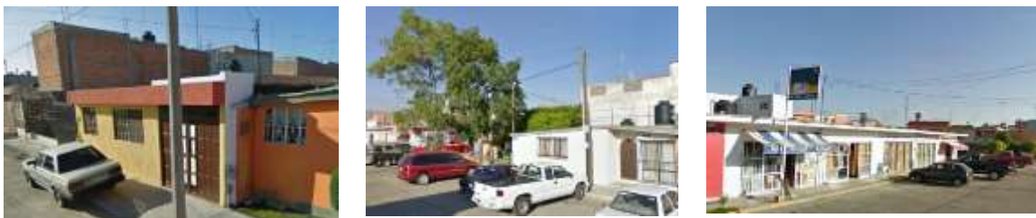
Figura 3. Imagen de las viviendas en la unidad de análisis sur.

La primera unidad de análisis se encuentra ubicada al sur de la ciudad de San Luis Potosí 2 y se caracteriza porque 24.6% de su población es mayor a 60 años, 41.2% de su población es mayor a 45 años y 30% de su población ocupada recibe un ingreso mayor a 5 vsm 3 . y 33% menor a 2 vsm.