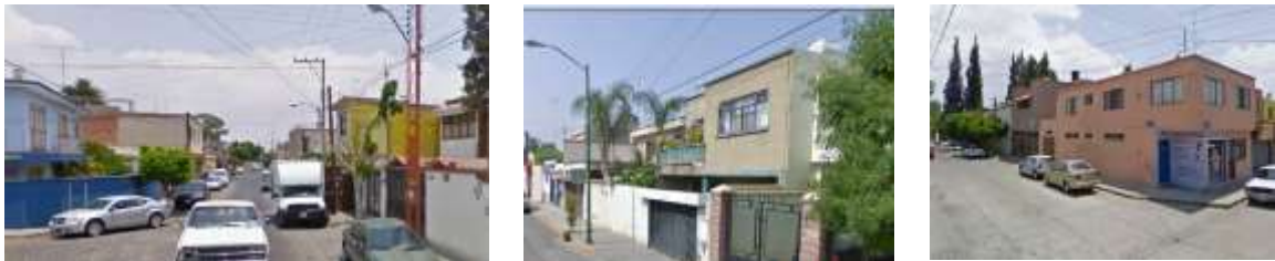
Figura 4. Imagen de las viviendas en la unidad de análisis 2

La segunda unidad de análisis se ubica en la zona centro de la ciudad de San Luis Potosí y se caracteriza porque 23.2% de su población es mayor a 60 años, 40.8% de su población es mayor a 45 años y 36% de su población ocupada recibe un ingreso mayor a 5 vsm y 32% menor a dos vsm.