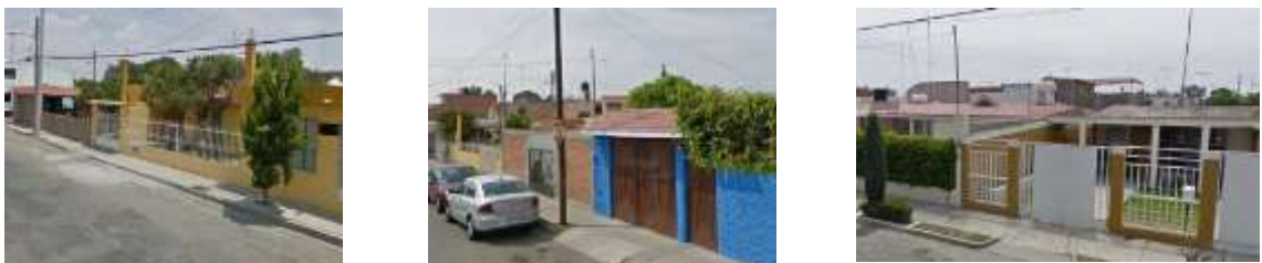
Figura 5. Imagen de las viviendas en la unidad de análisis 3

La tercera unidad de análisis se localiza al norte de la ciudad de San Luis Potosí y se caracteriza porque 23.55% de su población es mayor a 60 años, 38.8% de su población es mayor a 45 años y 27% de su población ocupada recibe un ingreso mayor a 5 vsm. y 36% menor a dos vsm.